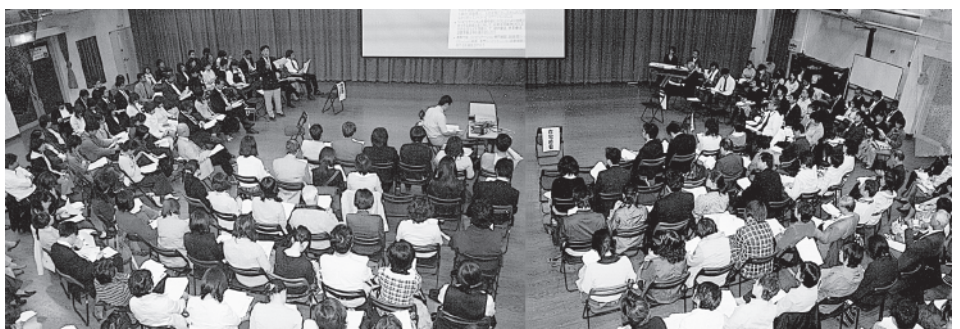
第116回シンポジウム「つなぐかかわり～地域連携を考える」(H20.5.20)

西区は何をめざしていくのか？ 「西区ケア連」の原点を振り返り、みなさんで考えましょう。多くのみなさまのご参加をお待ち申し上げます。